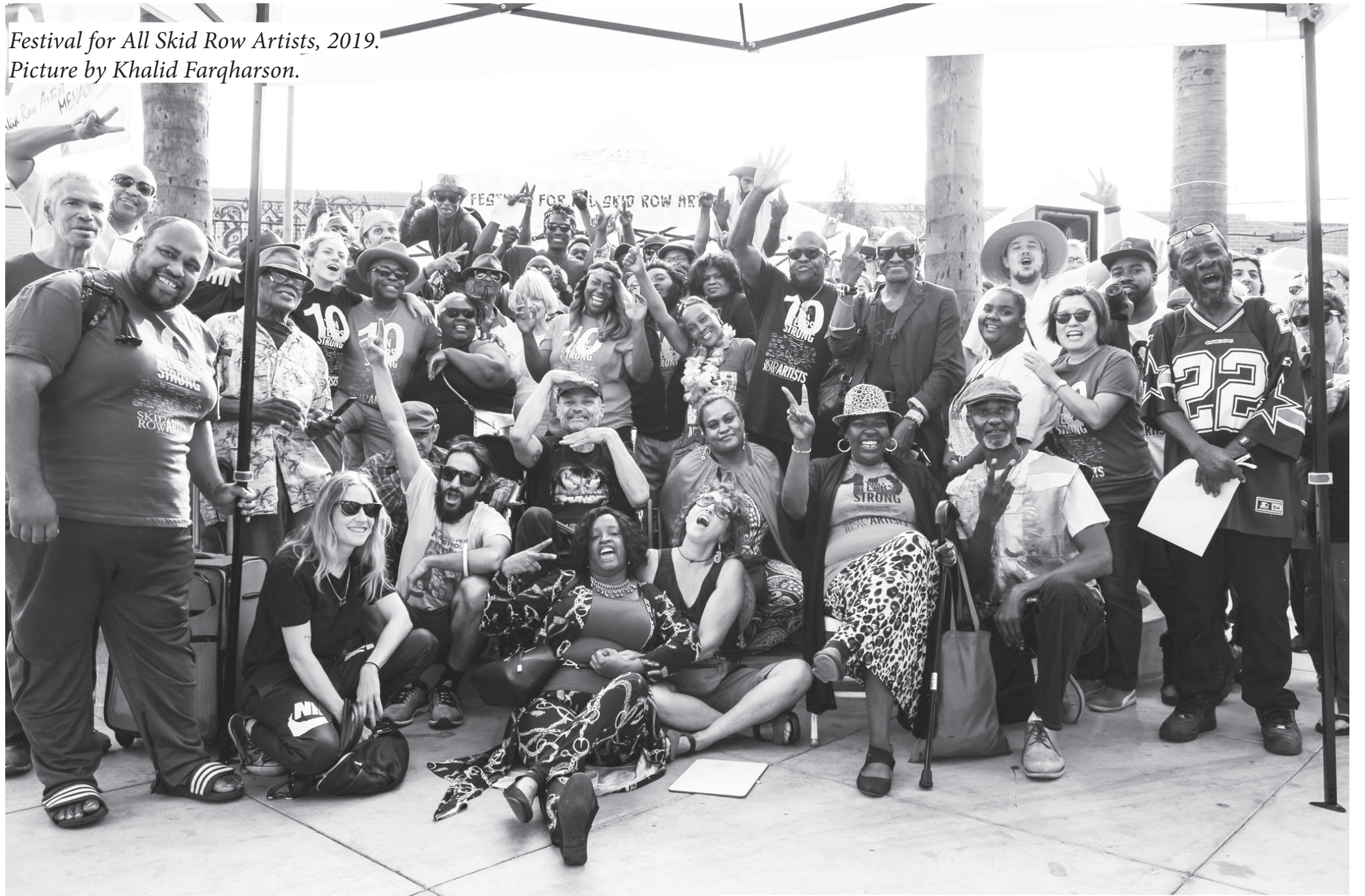
Festival for All Skid Row Artists, 2019.