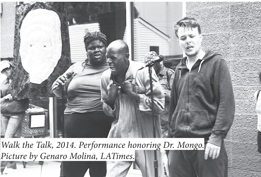
Walk the Talk, 2014. Performance honoring Dr. Mongo.